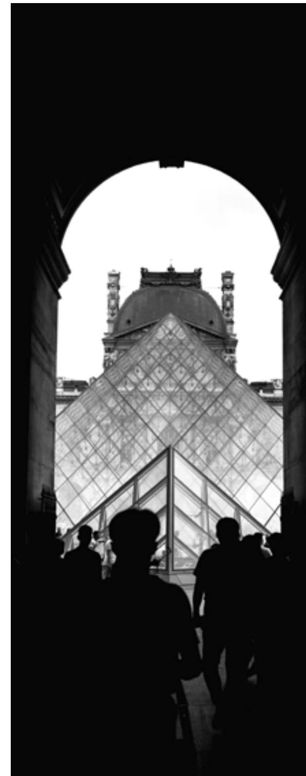
Vista del Museo del Louvre, París.