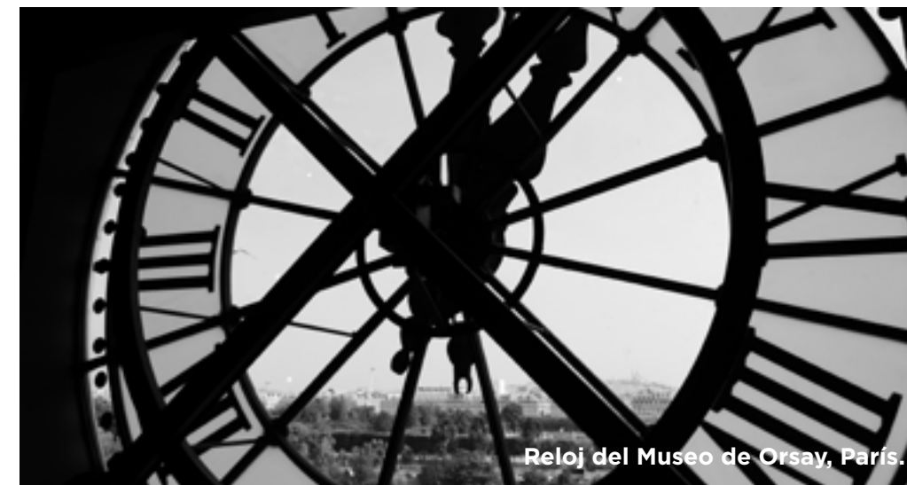
Reloj del Museo de Orsay, París.